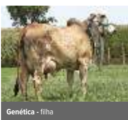
Genética - filha