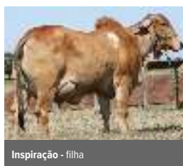
Inspiração - filha